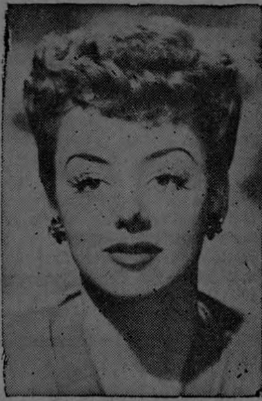
La glamorosa presencia que de modo tan atractivo muestra en esta foto la adorable ANNE SHIRLEY, estrella de RKO-Radio, es el resultado de saberse tan seductora como se puede ser, hace ver el famoso estilista de Hollywood Max Factor Jr.

La pereza es el manantial de la mayor parte de las faltas y defectos que he mencionado. La gordura y los músculos flácidos suelen no ser otra cosa que el resultado de una pereza.