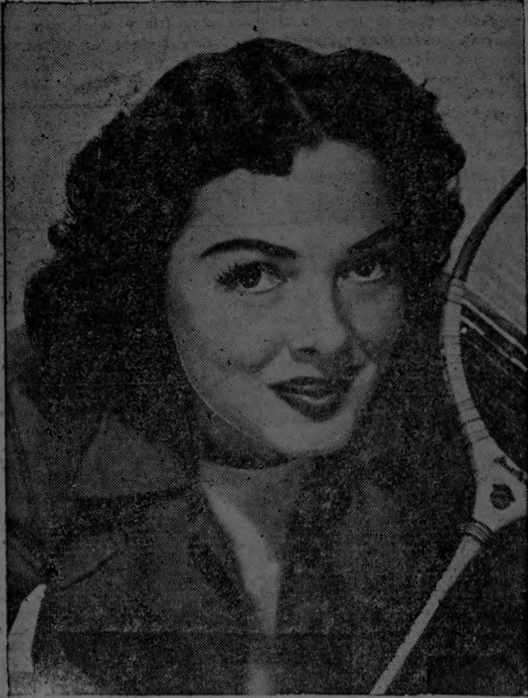
Kathryn Grayson, estrella de la Metro Goldwyn Mayer

Durante una reciente entrevista con Kathryn Grayson en los Estudios de la Metro Goldwyn Mayer, la graciosa estrella cantante dijo: